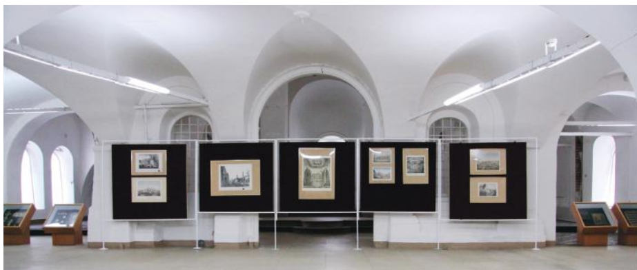
Выставка «За веру христианскую». Восточная сторона, общий вид

Создание нестационарной выставки, как, впрочем, и подготовка музеем любого другого зрелища, начинается с разработки научной концепции. В современной музейной практике при подготовке выставки разрабатывается один документ, имеющий промежуточное положение между научной и художественной концепцией, – сценарная концепция. Ее подготовкой занимаются сотрудники профильного по тематике выставки или выставочного отдела музея. Исходя из профиля коллекции музея и актуальности разрабатываемых научных тем, в портфеле музея целесообразно иметь до десятка нестацио-