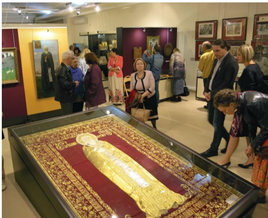
На выставке «И свеча не угасла...» СПМЗ. 2014 г.

Выставка состояла из нескольких тематических комплексов, посвященных конкретным областным музеям, в которые входили фотографии и предметы, размещенные на подиумах и манекенах. Постеры, развешенные по мобильным стенам, являлись своеобразным фоном-задником, визуализирующим информацию о месте нахождения и облике зданий-памятников, а также внутреннем убранстве интерьеров музеев, где расположены уникальные предметы. Музейные экспонаты (до 10 единиц) размещались рядом, формируя у зрителя ощущение подлинности и аутентичности видимого пространства. Предметы сопровождала фотография его состояния до реставрации. В число музей-