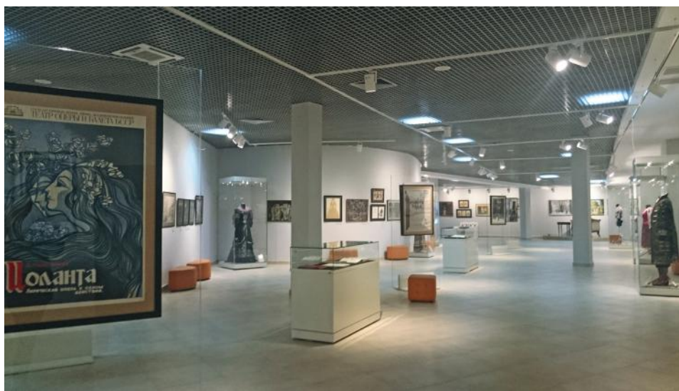
Выставочный проект «Театр Чайковского» в МВК «Новый Иерусалим»

Особое место в нестационарной деятельности музеев занимают обменные выставки из музейных собраний, которые, как правило, строятся на взаимном профессиональном интересе в сфере научно-исследовательской деятельности, общности профиля собрания и предмета комплектования, междисциплинарном, комплексном подходе. Такие выставки являются результатом высокой степени изученности коллекций, хорошей сохранно-