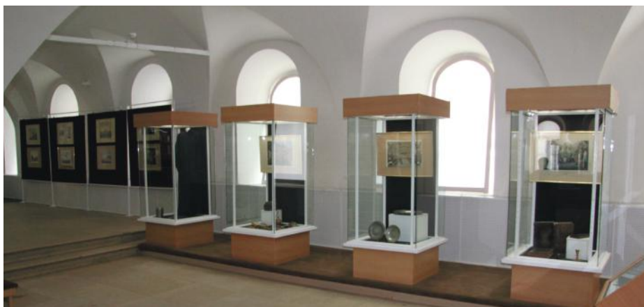
Выставка «За веру христианскую». Южная сторона, общий вид