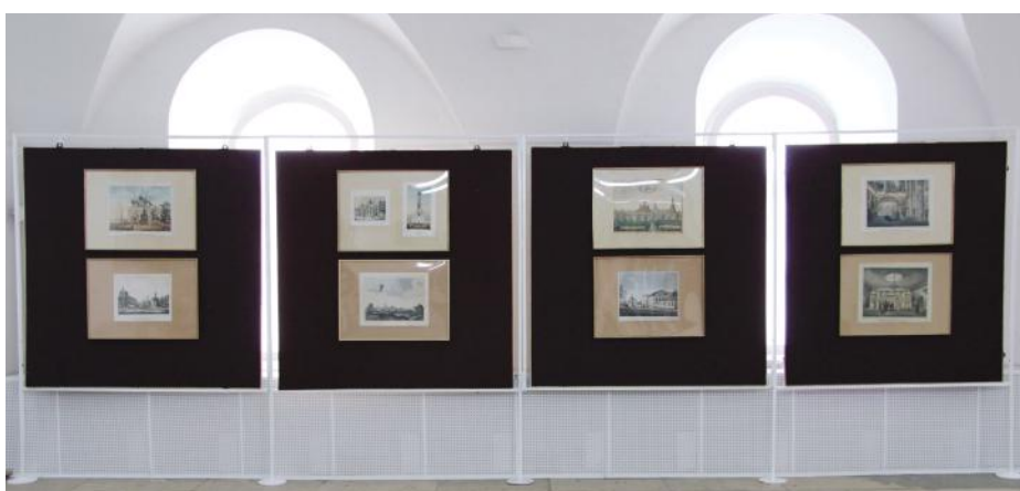
Щиты на стойках. Общий вид