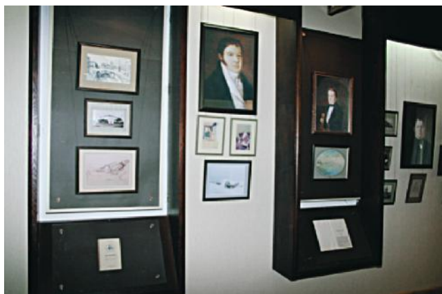
Демонстрация выставки в музее-усадьбе Н.Г. Чернышевского (г. Саратов)

Выставка «И.А. Гончаров и Симбирск» была создана в год 200-летия со дня рождения И.А. Гончарова – в 2012 году. За это время в рамках межвыставочного обмена экспонировалась в Музее-усадьбе Н.Г. Чернышевского (Саратов), в Государственном литературно-мемориальном музее-заповеднике Н.А. Некрасова «Карабиха» (Ярославская обл.), в Литературном музее г. Пенза.